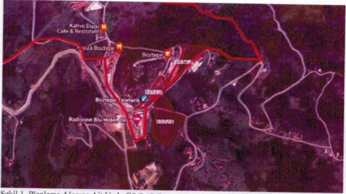
Şekil.1. Planlama Alanına Ait Uydu Görüntüsü

Planlama alanı Altınordu İlçesi, Nizamettin Mahallesi 390 ada 12 nolu parsel ve Orhaniye Mahallesi 2672 ada 3, 4 nolu parseli kapsamakta olup, G39B03A1C uygulama imar planı paftasında yer almaktadır.