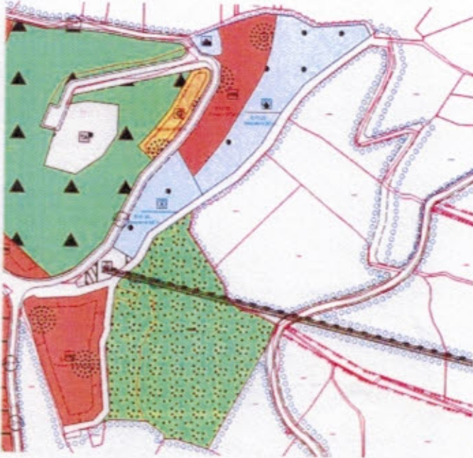
Şekil.2. Mevcut 1/1000 ölçekli Uygulama İmar Planı

Altınordu İlçesi, Orhaniye Mahallesi 2672 ada 3, 4 nolu parseller mevcut imar planında sosyal tesis alanı olarak; Nizamettin mahallesi 390 ada 12 nolu parsel ise park alanı olarak planlanmıştır.