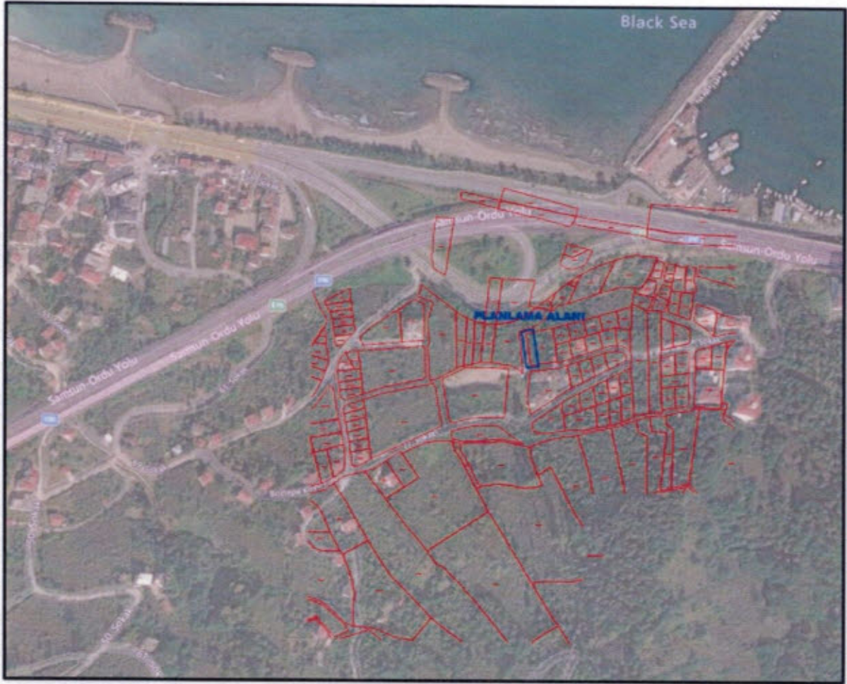
Görsel 1: Planlama Alanı Uydu Görüntüsü

Planlama alanı, 1/1000 ölçekli hâlihazır haritaların F39C22C2C no'lu paftada yer almaktadır.