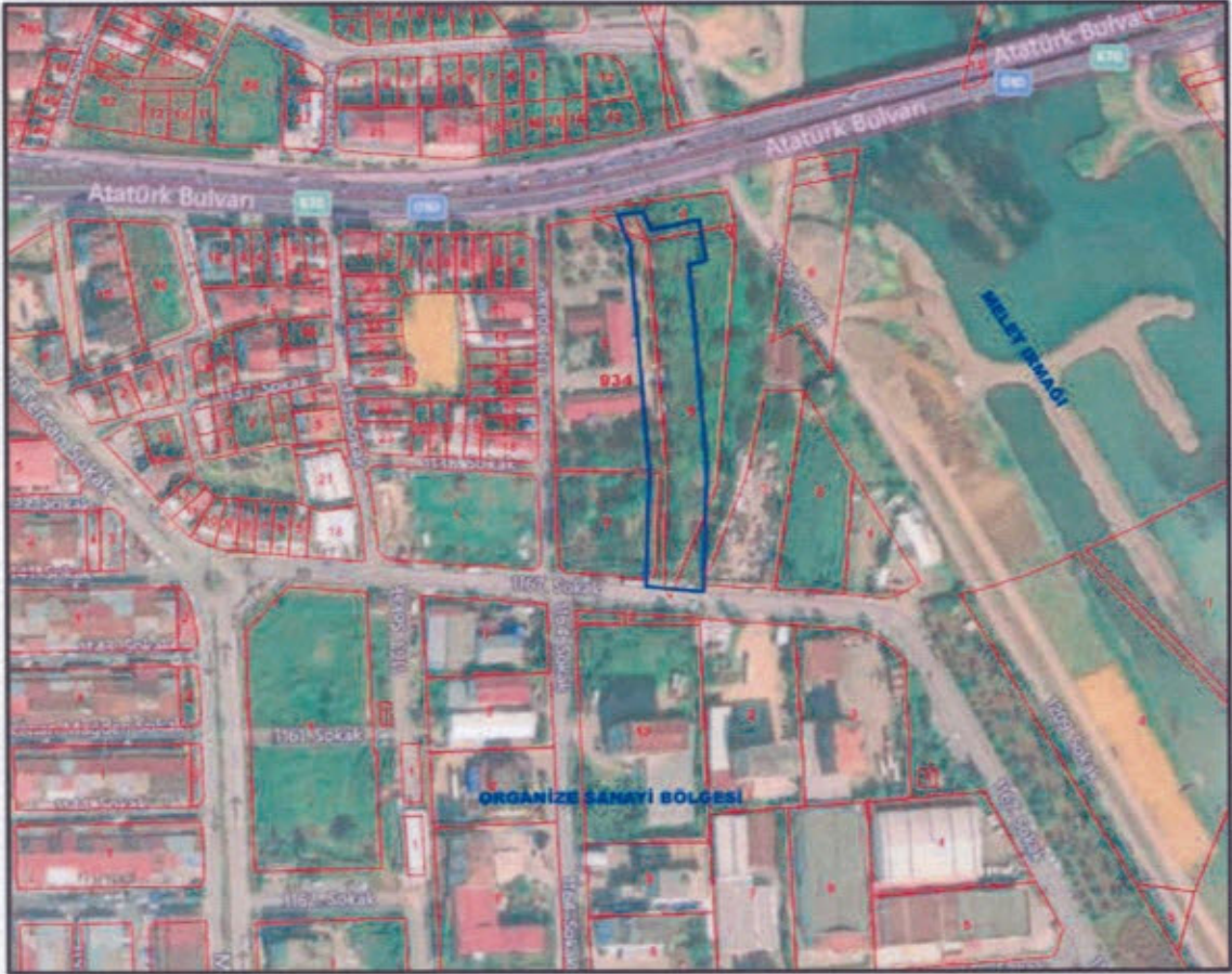
Görsel 1: Planlama Alanı Uydu Görüntüsü

Planlama alanı, 1/1000 ölçekli hâlihazır haritaların G39B04B4C ve G39B04C1B no'lu paftalarında yer almaktadır.