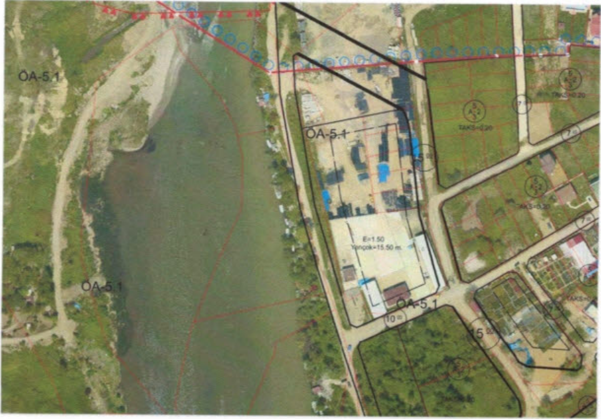
Şekil 1: Uydu Görüntüsü

İş bu plan değişikliği söz konusu ilgili kanunlar doğrultusunda işlem yapılmak üzere 5216 sayılı Büyükşehir Belediyesi kanununun 7-b, 7-c ve 14.Maddeleri gereği Ordu Büyükşehir Belediyesi İmar ve Şehircilik Dairesi Başkanlığınca hazırlanmıştır.