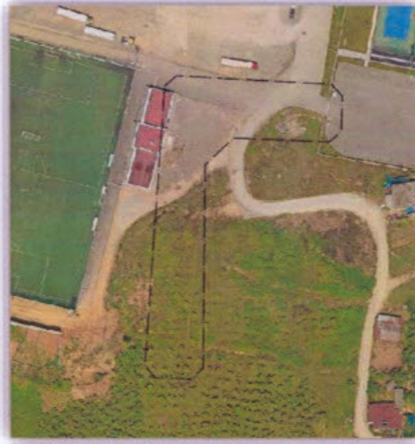
Görsel 1: Planlama Alanı Uydu Görüntüsü

1/1000 Ölçekli Uygulama İmar Planı Değişikliğine konu alan; Ordu ili, Altınordu İlçesi, Karşiyaka Mahallesinde bulunan 4985 ada 6,8 ve 19 parsellerini içeren 2.618 m 2 planlama alanında bulunmaktadır.