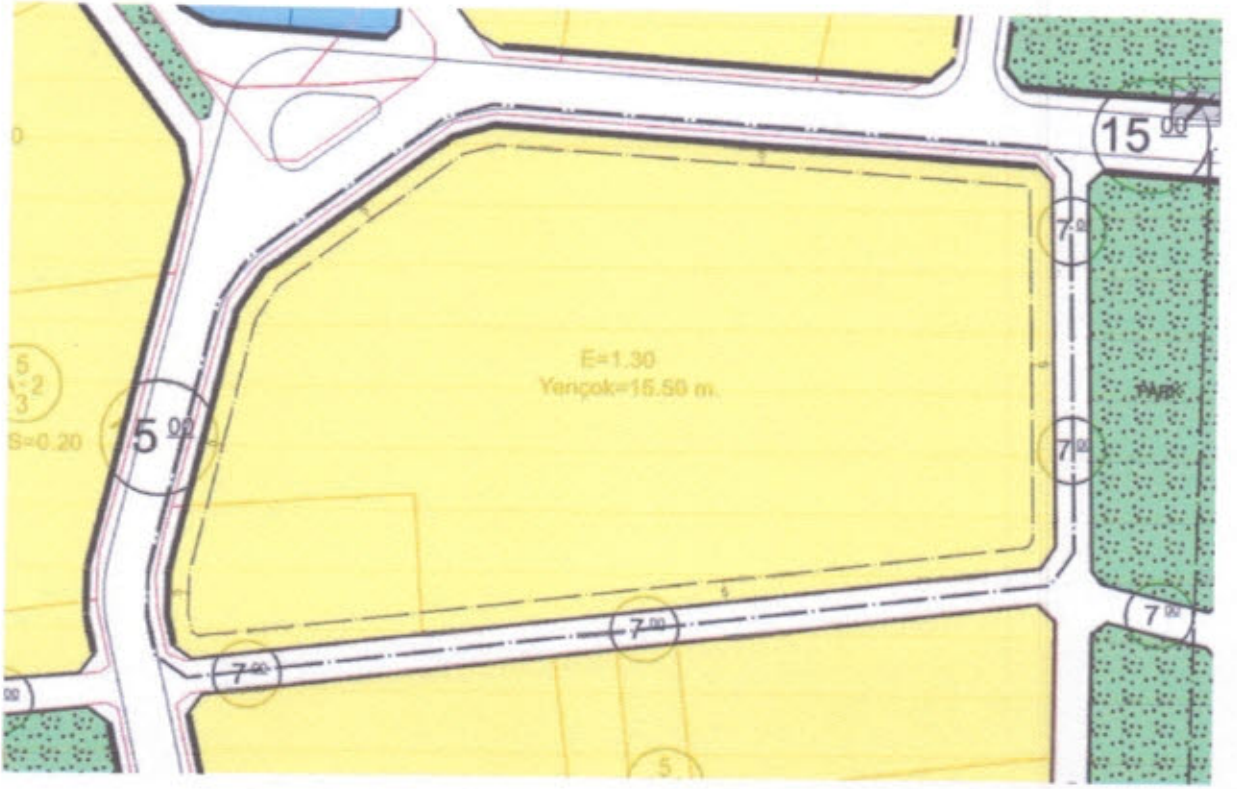
Şekil 2: Uygulama İmar Planı Değişikliği Sonrası Durum

İlgililerince hazırlanan söz konusu imar planı değişikliği teklifi 5216 sayılı Büyükşehir Belediye kanununun 7/b ve 3194 sayılı imar kanununun 8/b maddesi uyarınca Altınordu Belediye Meclisi ve Ordu Büyükşehir Belediye meclisince onaylanarak yürürlüğe girer.