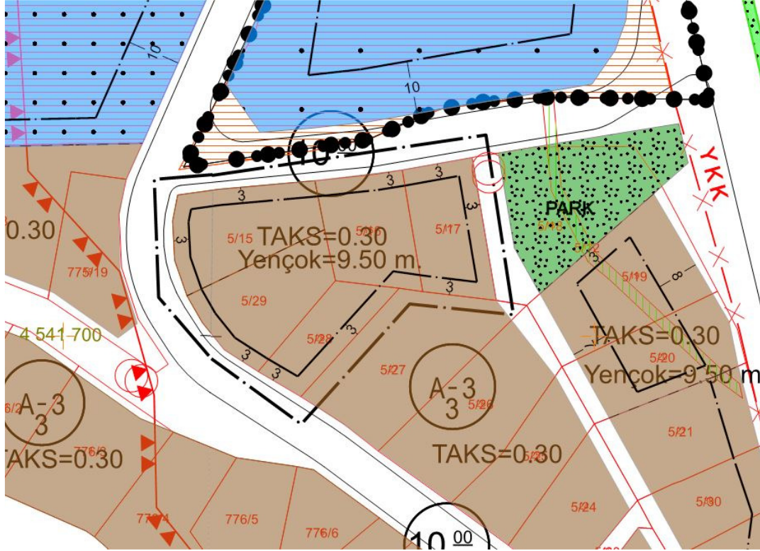
Şekil 3: Uygulama İmar Planı Değişikliği Sonrası Durum

Bunun yanında söz konusu parsellerin aynı mülkiyet sahipliğinde olması ve tevhit edilerek toplu yapılaşma planlandığından parseller üzerinde işli bulunan yapı yaklaşma mesafeleri yeniden düzenlenmiştir. Yapılaşma parametrelerinde herhangi bir değişikliğe gidilmemiş olup TAKS:0,30 Y ençok: 9,50 m olarak planlanmıştır.