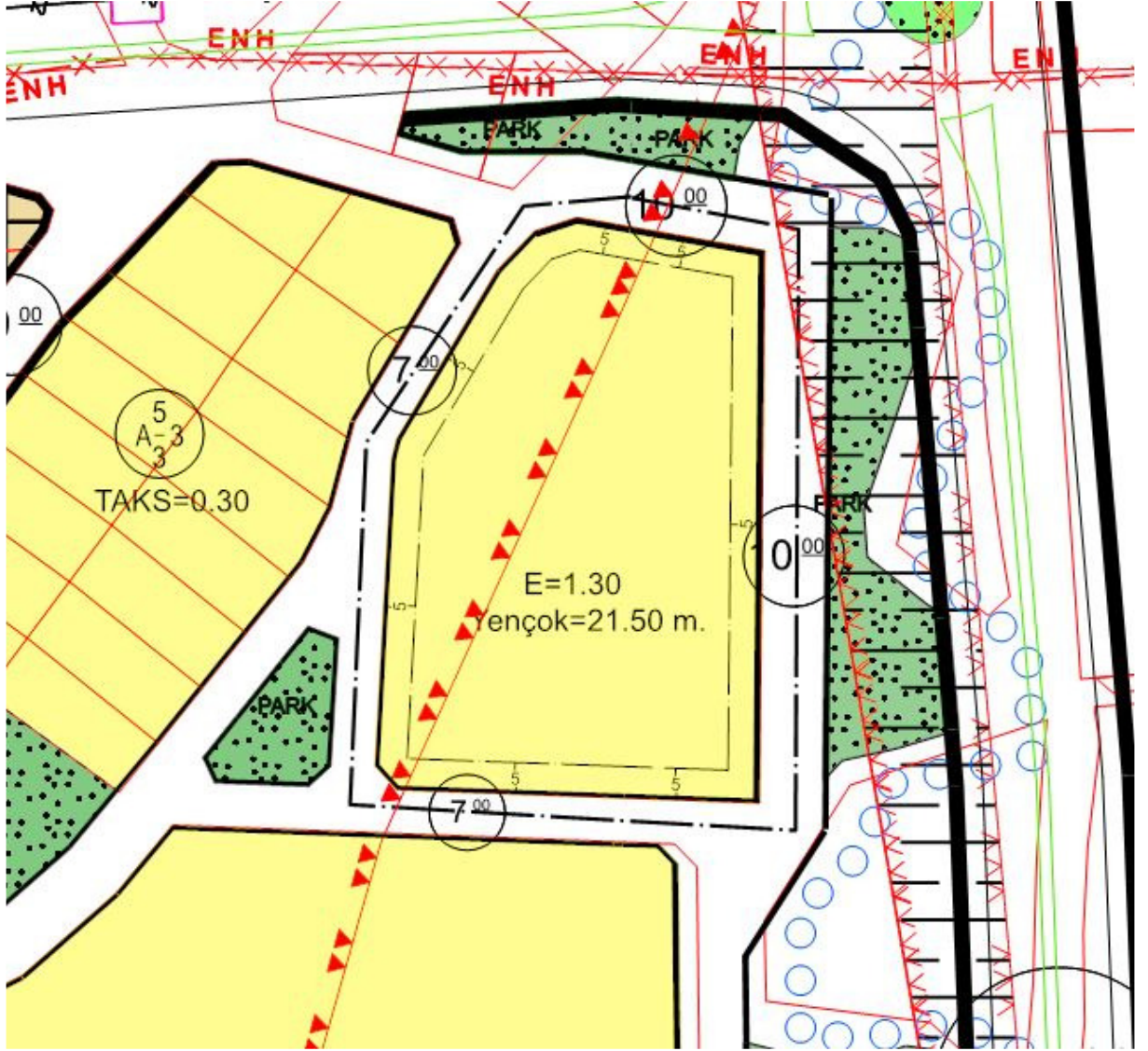
Şekil 2: Uygulama İmar Planı Değişikliği Sonrası Durum

İlgililerince hazırlanan söz konusu imar planı değişikliği teklifi 5216 sayılı Büyükşehir Belediye kanununun 7/b ve 3194 sayılı imar kanununun 8/b maddesi uyarınca Altınordu Belediye Meclisi ve Ordu Büyükşehir Belediye meclisince onaylanarak yürürlüğe girer.